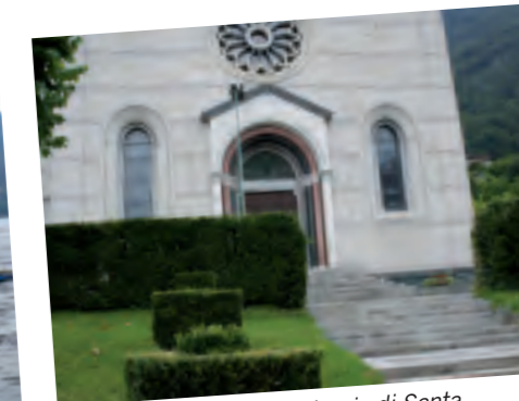
MASLIANICO, con il santuario di Santa Teresa del Bambino Gesù di Lisieux