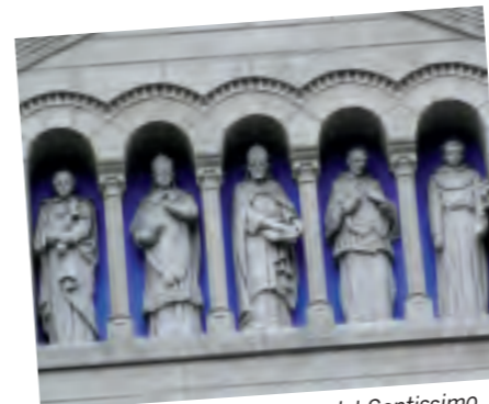
CERNOBBIO, con la chiesa del Santissimo Redentore