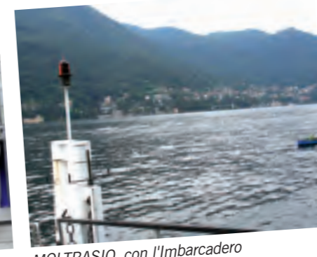
MOLTRASIO, con l'Imbarcadere