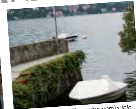
CARATE URIO, con il vecchio porticciolo