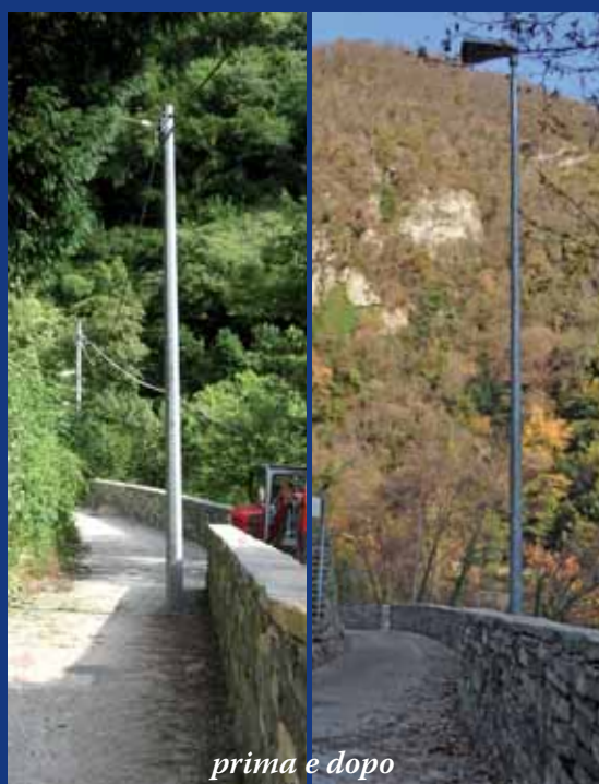
prima e dopo

è risolto l'annoso problema dei pali che intralciavano il transito dei veicoli e in particolare dei mezzi di soccorso/servizio.