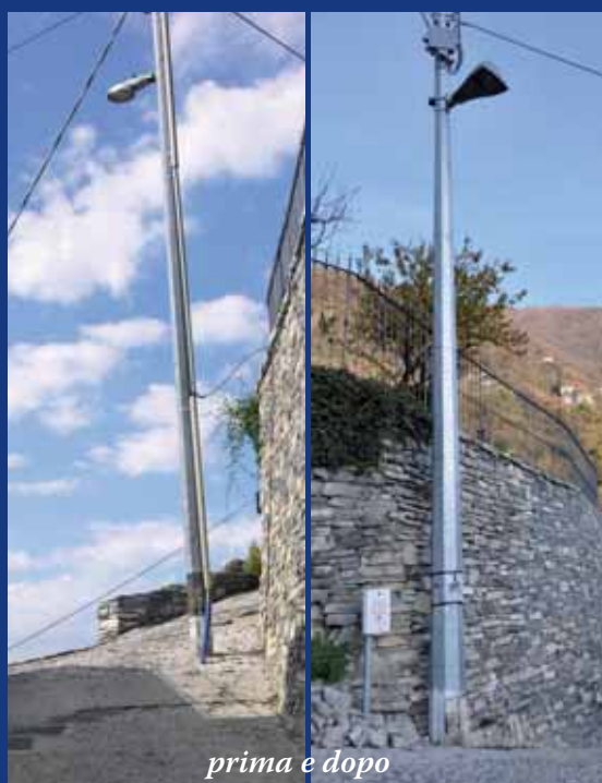
prima e dopo