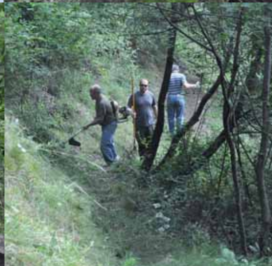
prima e dopo